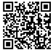
QRコードにアクセス!